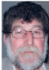
Erdoğan Øzhayat Odsherred integrationsråd