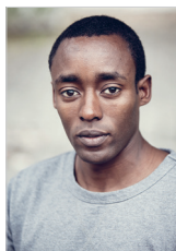
Claude Shukuru Munyamanyi Frederikshavn Integrationsråd