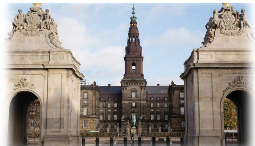
Foto: Christiansborg Slot.

Folketinget vedtager alle love, der gælder i Danmark. Dermed har Folketinget meget stor indflydelse på, hvordan hverdagen ser ud for de personer, der bor her i landet. Det gælder alt lige fra hvilke fag folkeskolen skal undervise i, til hvad man kan blive straffet for.