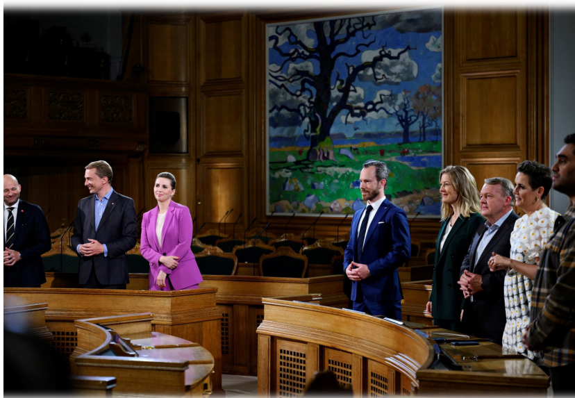
Foto: Debat mellem partilederne, 2021.

Det betyder noget, hvilke partier der er i Folketinget, og hvilke medlemmer der bliver valgt ind.